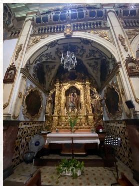
1. Capella de Sant Josep