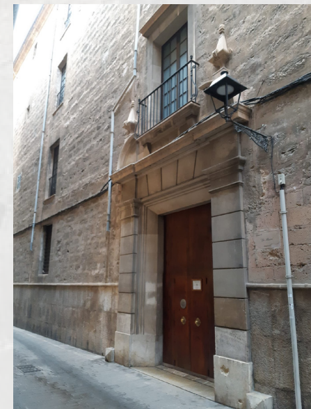
Església de la Congregació de la Missió des de 1764