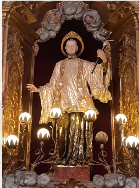
2. Kaplica Matki Bożej Cudownego Medalika