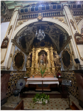
1. Kaplica św. Józefa