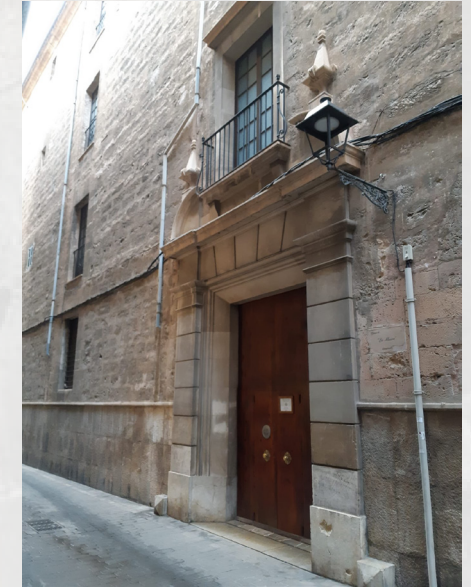
Kościół Zgromadzenia Misji od 1764r.