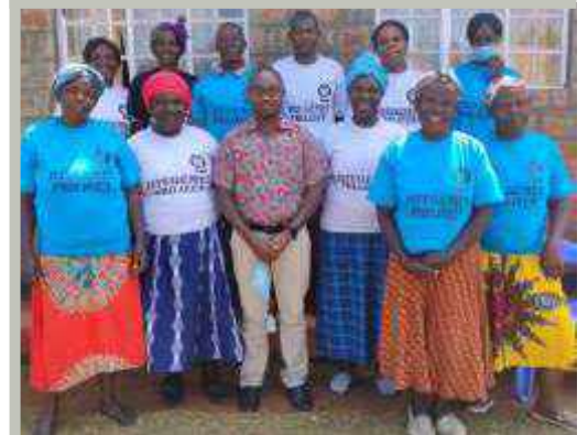
Foto grupal de participantes de St. Kizito, Parroquia de Matisi

grupos parroquiales para compartir historias de éxito y superación de desafíos. Al compartir estas historias, continúan aprendiendo unos de otros. Se les alienta a expandir sus negocios y continuar recibiendo capacitación sobre administración del dinero. Especialmente popular es el componente de ahorro de la administración de préstamos. Los participantes se han vuelto más seguros en sus actividades comerciales y sienten que serán más resistentes cuando enfrenten tiempos difíciles. Ahora tienen esperanza para el futuro.