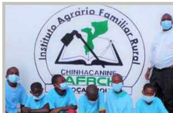
Estudiantes y Padre Cine C. Inueiua, C.M. en la Entrada Principal de la Institución