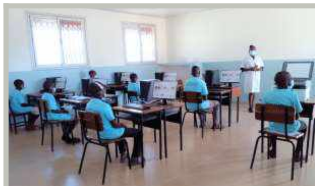
Aula de informática ya montada con los alumnos y el profesor de informática, explicando cómo cuidar los ordenadores.

La Comunidad Vicentina estaba buscando maneras de mejorar las oportunidades para los jóvenes de la zona. Con la ayuda de VSO, pudieron agregar un laboratorio de computación a la escuela. Compraron seis computadoras, una tableta y una impresora. Un carpintero ayudó con mesas y sillas. Emplearon a un instructor y agregaron estudios de computación al plan de estudios. Con sus nuevos conocimientos informáticos, los graduados tendrán mejores perspectivas de empleo. Si bien aún se encuentra en las primeras etapas, ha tenido un buen comienzo y ha enriquecido el plan de estudios para los 60 estudiantes participantes.