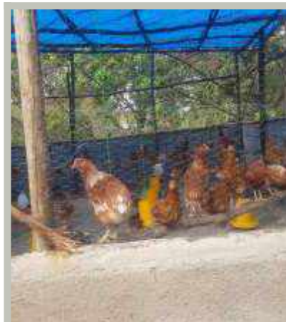
Gallinas ponedoras de huevos en gallinero nuevo en la Parroquia de Alem Tena

construyó el gallinero, lo sembraron con una raza de pollo recomendada por un experto local. Además de generar ingresos, este proyecto